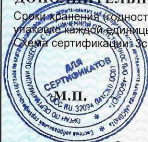
Схема сертификации ЗС

Сроки хранения (годности) указаны в прилагаемой к продукции товаросопроводительной документации и/или на упаковке каждой единицы продукции.